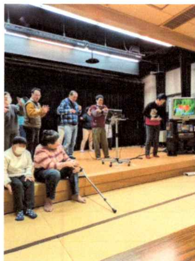
《大盛り上がりの新年カラオケ大会の様子》