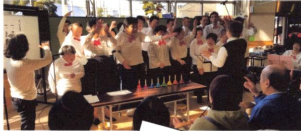
センターフェスティバルで発表する 『こうぼう山の会』のみなさん