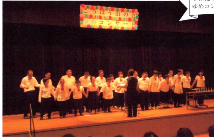
令和元年 ゆめコンサート