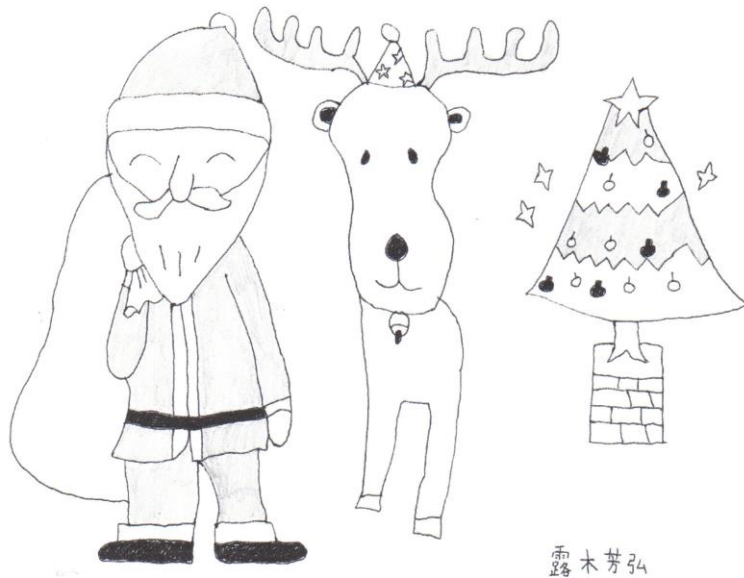
こうぼう山の会 露木芳弘氏 作成