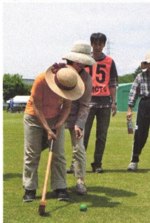
〔グランドゴルフの様子〕