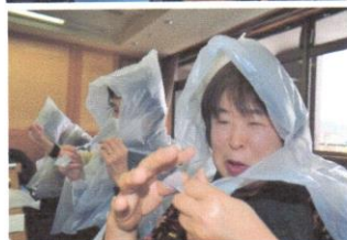
家庭のごみ袋で、雨合