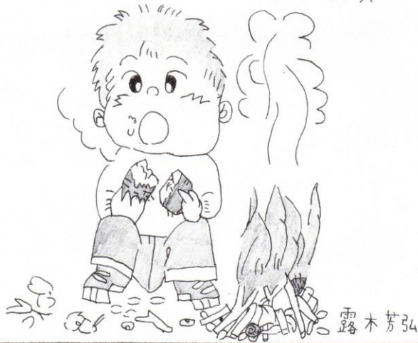
こうぼう山の会 露木芳弘氏 作成