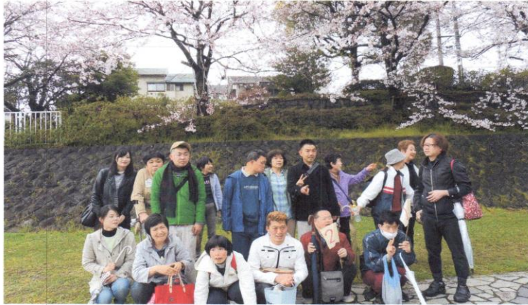
(今年は雨上がりのお花見ハイキング。桜がきれい、笑顔が素敵。)