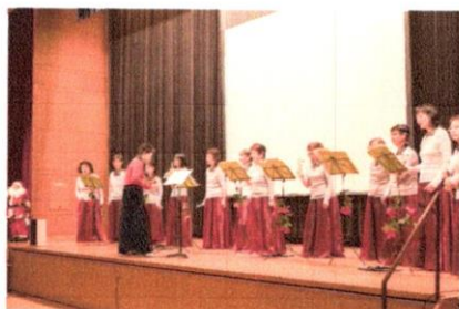
コールソネットの素晴らしい歌声