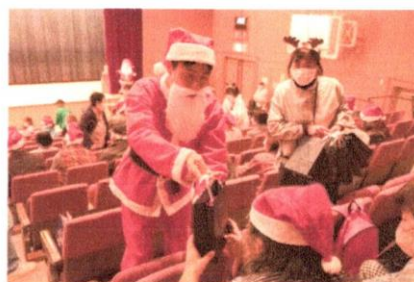
プレゼントありがとう