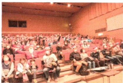
みんなでハイポーズ！