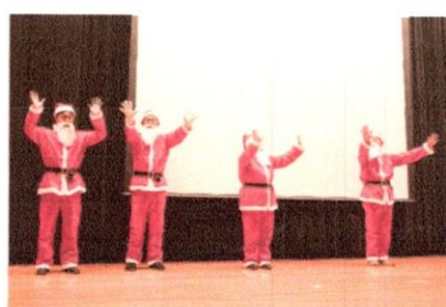
サンタさん勢ぞろいです