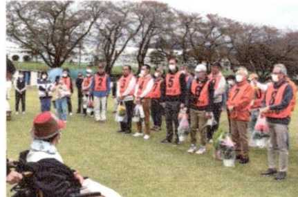
参加者からお礼のお花をプレゼント