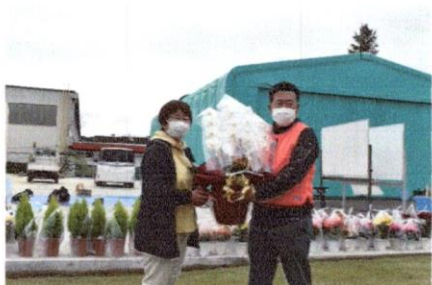
胡蝶蘭を贈りました