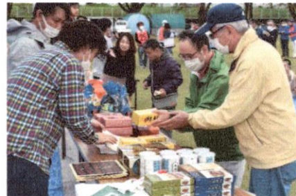
どれにしようかな?