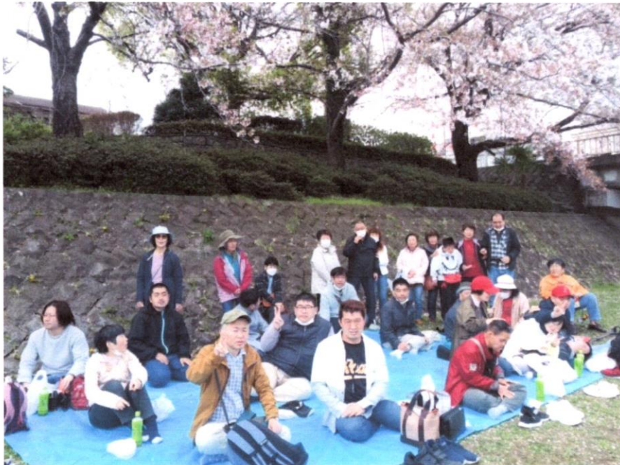
〈満開のさくらと満開の笑顔と〉

☆4月3日（月）10:00～12:00、保健福祉センターで定例の委員会を開きました（参加者；9名）。前日のお花見ハイキングの反省をし、5月21日（日）に予定されているこうぼう山の会総会の資料作りをしました。